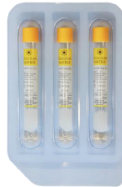
Cellular Matrix® Ref: A-CP-HA-3

Obtention d'environ 2mL de PRP associés à 2mL d'acide hyaluronique (4mL de sang prélevés)